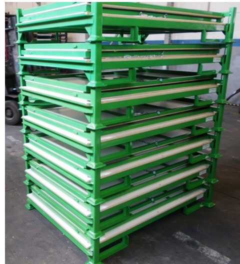
Leergut im Stapel in RAL 6017