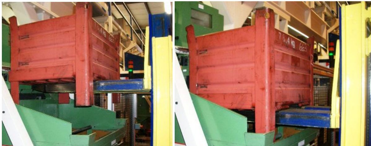
Aufsetzen des Klappbodenbehälters mit einem Gabelstapler zur Entleerung

Der Klappbodenbehälter findet seinen Einsatz zur Lagerung, Transport und Umfüllen von verschiedenen Wertstoffen, Materialien und Kleinteilen. Der Behälter wird mit dem Gabelstapler verfahren, man benötigt keine Krananlage zur Entleerung. Die Entleerung erfolgt über den Klappboden des Blechbehälters, siehe Fotos unten. Das Material rutscht von alleine über die glatte Bodenplatte aus dem Behälter hinaus.